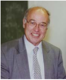
Sir Michael Atiyah