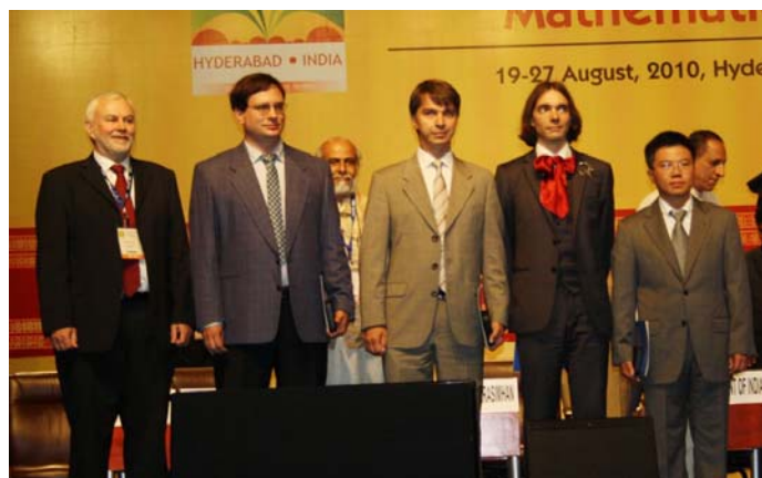
El Secretario de la IMU junto con los cuatro galardonados con la Medalla Fields

La Presidenta de la República entregó las Medallas Fields, el Premio Nevalinna, el Premio Gauss y el Premio Chern a los galardonados. Las Medallas Fields han correspondido a los profesores Elon Lindenstrauss (Universidad Hebrea de Jerusalén y Universidad de Princeton), Ngô Bảo Châu (Universidad París Sur, Orsay), Stanislav Smirnov (Universidad de Ginebra) y Cédric Villani (Escuela Normal Superior de Lyon e Instituto Henri Poincaré de París).