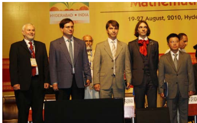
El Secretario de la IMU junto con los cuatro galardonados con la Medalla Fields

La Presidenta de la República entregó las Medallas Fields, el Premio Nevalinna, el Premio Gauss y el Premio Chern a los galardonados. Las Medallas Fields han correspondido a los profesores Elon Lindenstrauss (Universidad Hebrea de Jerusalén y Universidad de Princeton), Ngô Bảo Châu (Universidad París Sur, Orsay), Stanislav Smirnov (Universidad de Ginebra) y Cédric Villani (Escuela Normal Superior de Lyon e Instituto Henri Poincaré de París).