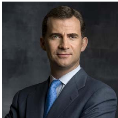
S.A.R. D. Felipe de Borbón y Grecia, Príncipe de Asturias

Presidente: S.A.R. D. Felipe de Borbón y Grecia, Príncipe de Asturias.