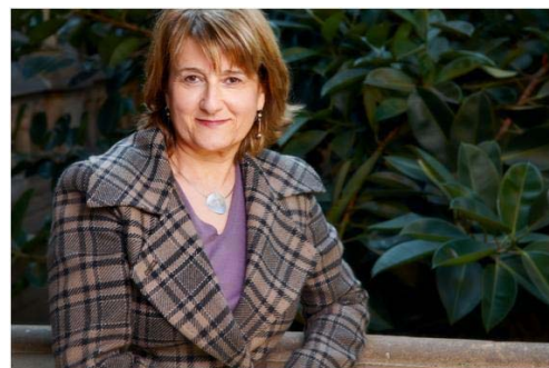
Marta Sanz-Solé, presidenta de la EMS

La profesora Marta Sanz-Solé, catedrática de la Universitat de Barcelona, ha asumido el pasado día 1 de enero la presidencia de la European Mathematical Society (EMS), cargo para el que fue elegida el día 10 de julio de 2010 en la Reunión del Council de la EMS en Sofía.