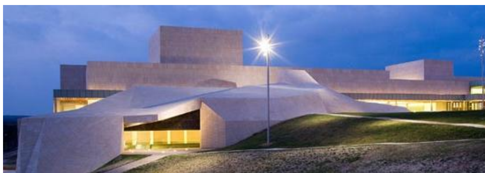
Palacio de Congresos de Ávila

La programación científica consiste en diecisiete sesiones especiales y once conferencias plenarias, con más de doscientas intervenciones en total, y dos sesiones de pósters.