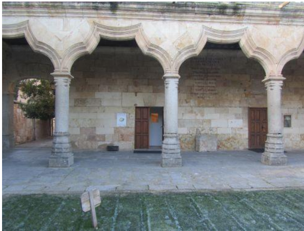
Patio de las Escuelas Menores

http://obrasocial.lacaixa.es/nuestroscentros/cosmoaixamadrid/cosmoaixamadrid_es.html