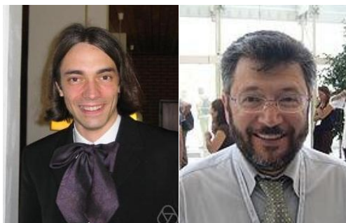
Cédric Villani (Medalla Fields 2010) y Efim Zelmanov (Medalla Fields 1994)

El próximo martes, día 1 de febrero, el Congreso del Centenario de la Real Sociedad Matemática Española, RSME 2011, comenzará en el Palacio de Congresos de Ávila, con la conferencia inaugural de Cédric Villani a las 10 horas, a la que seguirá la Ceremonia inaugural. Se recomienda puntualidad.