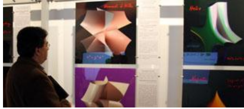
La muestra en Salamanca