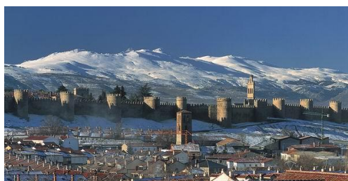
Muralla de Ávila

El registro estará abierto en el Palacio de Congresos desde las 9 horas. La inscripción podrá realizarse durante la celebración del Congreso.