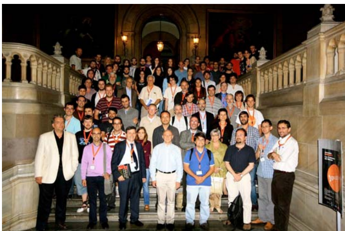
Foto oficial de los participantes