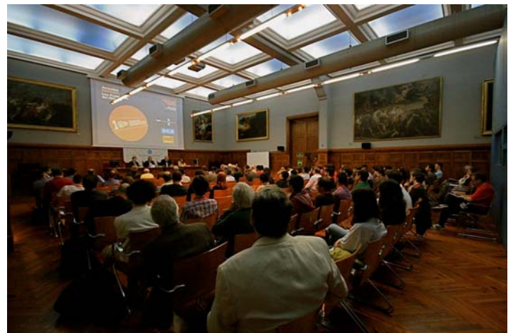
Panorámica de los asistentes al acto inaugural