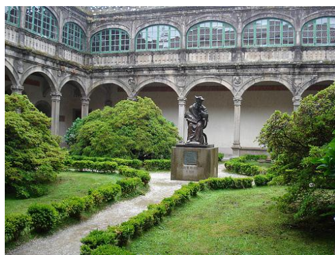
Universidad de Santiago de Compostela