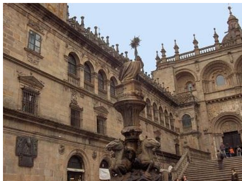
Plaza de Platerías en Santiago de Compostela

Se incluyen en el programa las dieciocho sesiones especiales aprobadas por el comité científico, cuya duración en cada caso está precisada en la web del congreso. Los temas de dichas sesiones son los siguientes: Métodos numéricos para la resolución de ecuaciones no lineales; Aspectos de la matemática industrial en España; Funciones especiales, polinomios ortogonales y aplicaciones; Matemática discreta; Teoría de anillos no conmutativos; Interacciones matemática-informática; Análisis funcional; Análisis complejo y Teoría de operadores; Singularidades; Primer Encuentro Ibérico de Historia de las matemáticas; Análisis armónico; Aspectos topológicos de álgebra y geometría; Análisis geométrico; Geometría algebraica; Biomatemáticas; Matemáticas de la teoría de la información; Estadística; e Investigación operativa.