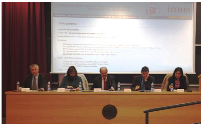
Mesa de inauguración