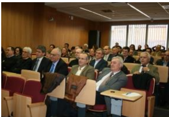
Público asistente al acto de inauguración

El programa detallado de las Jornadas y algunas de las presentaciones pueden consultarse en www.imus.us.es/actividad/1242 .