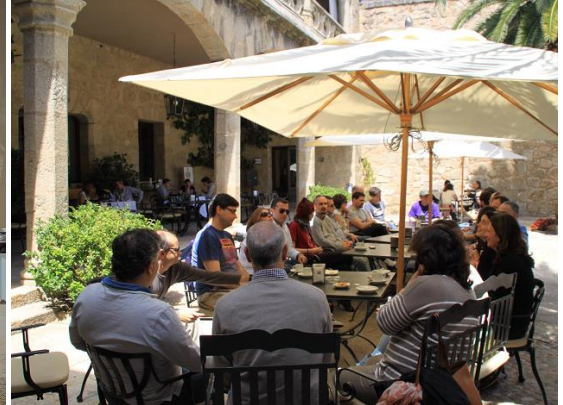
A la izquierda: foto de grupo de las Jornadas. Arriba: coloquio informal en el parador