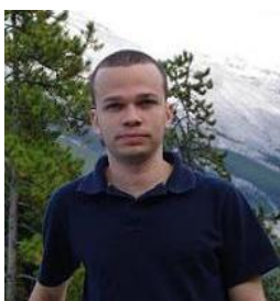
Fernando Codá Marqués