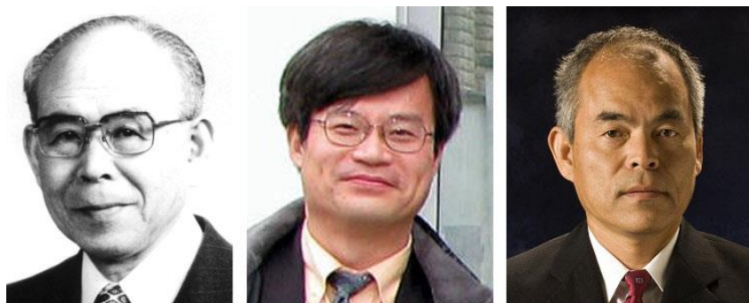
De izquierda a derecha: Isamu Akasaki, Hiroshi Amano y Shuji Nakamura