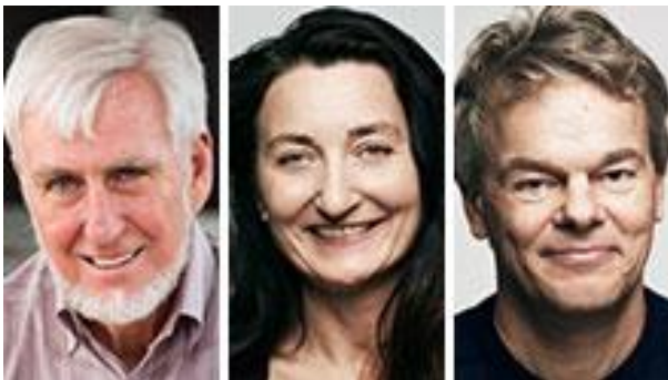
De izquierda a derecha: John O'Keefe, May-Britt Moser y Edvard I. Moser