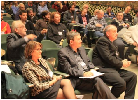
Participantes del BMD 2014

http://www.icmat.es/seminarios/files/2014/colouquo-21-11-14.pdf