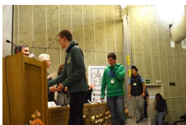
Entrega de diplomas de la fase local