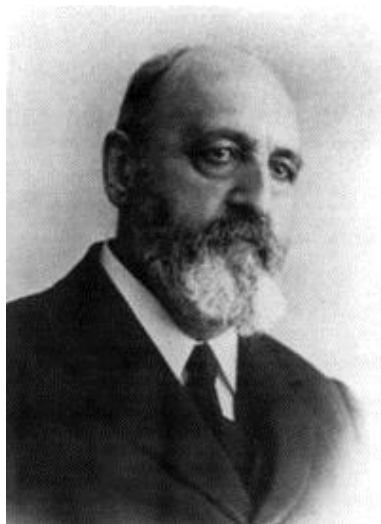
Leonardo Torres Quevedo