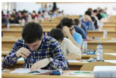
Durante las pruebas