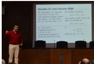
Charlas para los profesores acompañantes