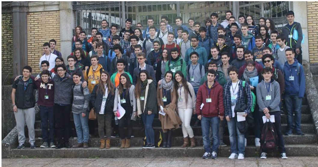
Foto grupal de la LI OME