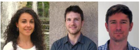
Conferenciantes de "Matemáticas en la vida cotidiana 2015"