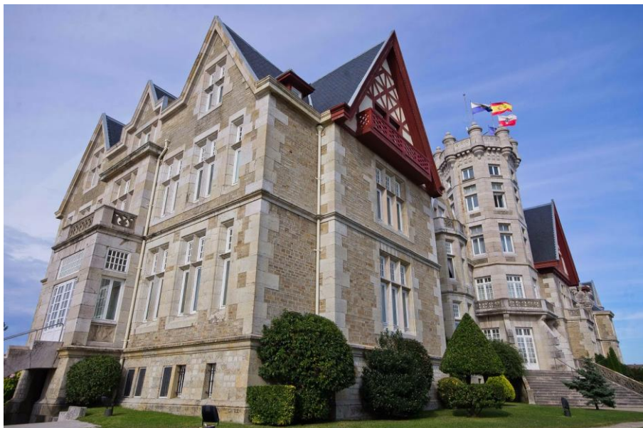
Palacio de la Magdalena