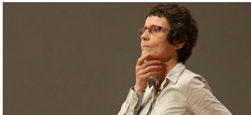
Claire Voisin dando la conferencia inaugural en el Collège de France el 2 de junio de 2016