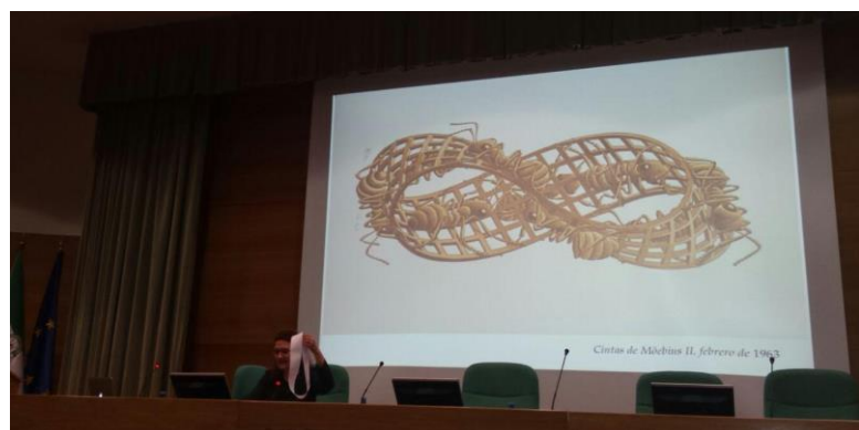
Mercedes Siles Molina durante su conferencia