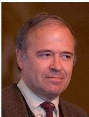
Miguel Ángel Revilla

El Comité para la Celebración del Centenario de la RSME agradece la colaboración en la difusión de esta iniciativa, que está siendo un excelente cauce de difusión de la cultura matemática.