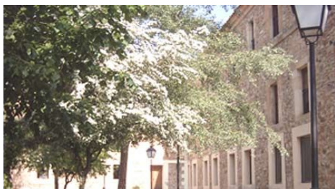
Fachada Residencia Duques de Soria