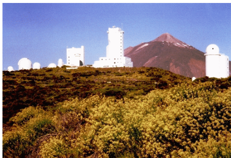
Observatorio de Izaña y el Teide

http://www.uimp.es/academicas/actividades-academicas.html