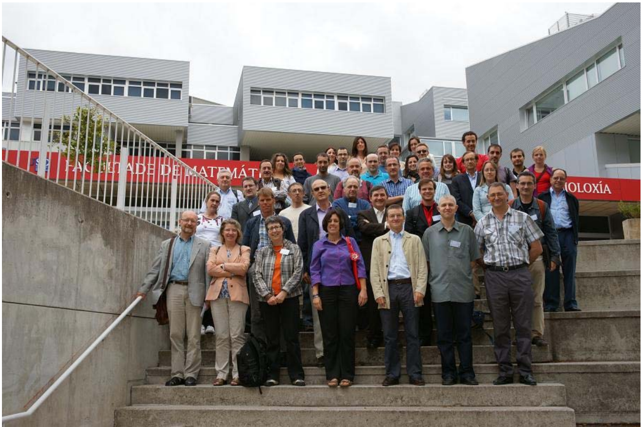
Foto de grupo de las Jornadas Científicas de Transferencia y Matemática Industrial, Santiago de Compostela