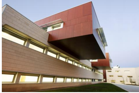
Edificio Científico Tecnológico del campus de la Universidad de La Rioja