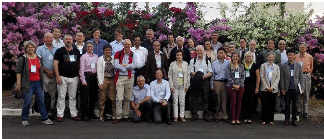
Foto de grupo de la reunión del consejo del ICIAM