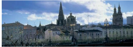
Panorámica de Logroño