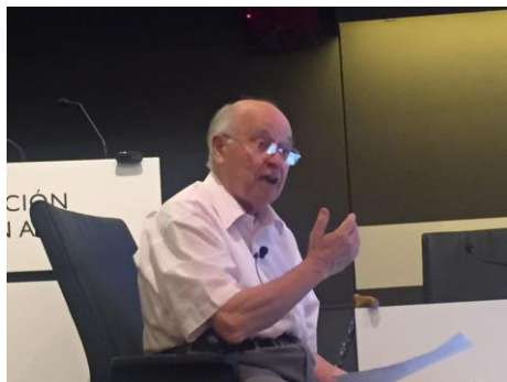
Michael Atiyah en su conferencia