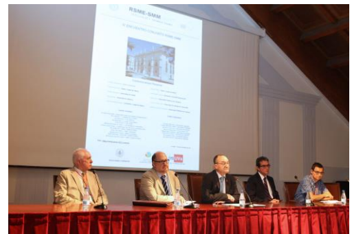
Miembros de la mesa inaugural