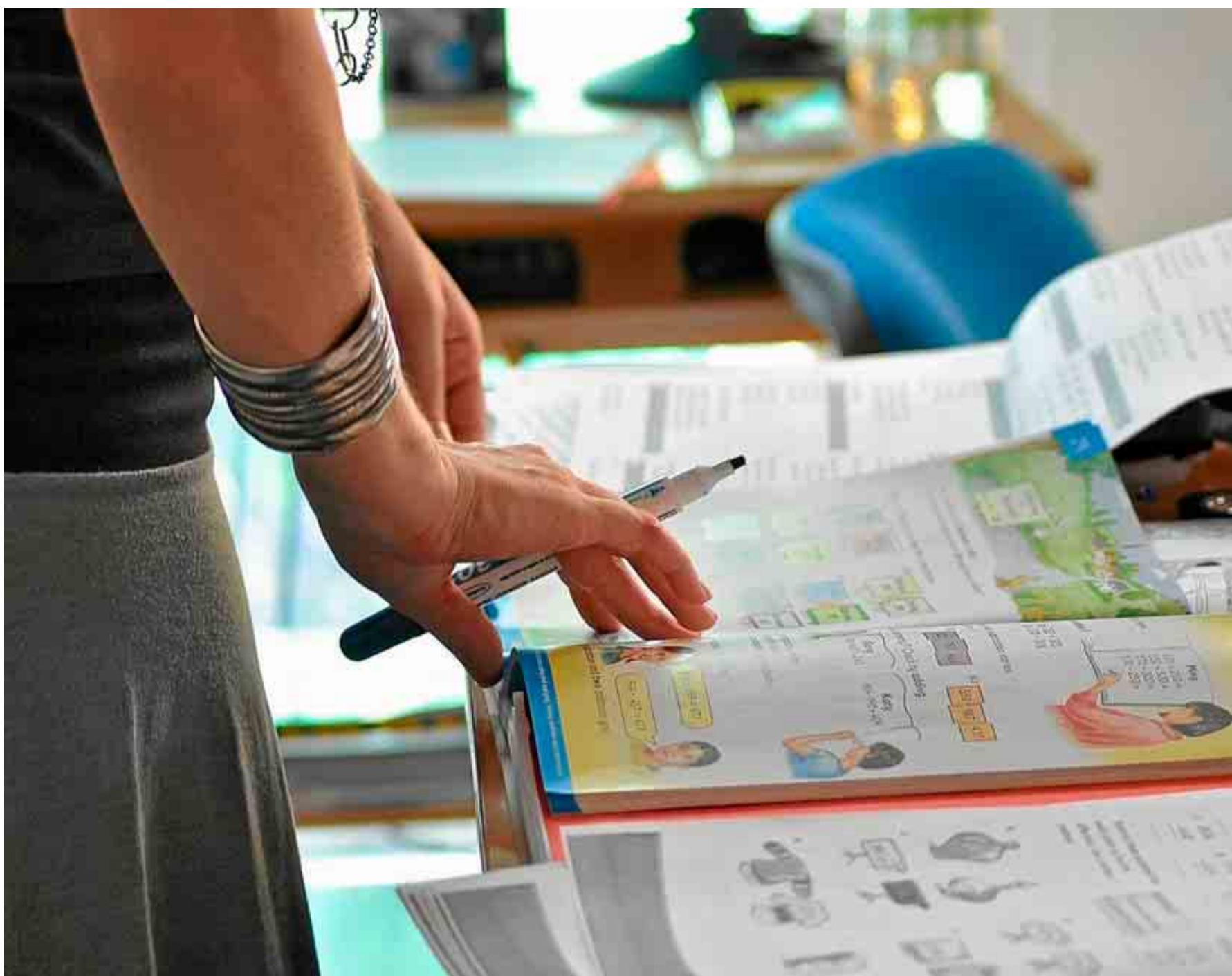
La falta de formación en materias como las matemáticas obliga a los maestros a una excesiva dependencia de los manuales, según algunas voces críticas.