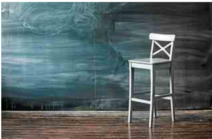
Cada vez se convocan menos plazas para la enseñanza.